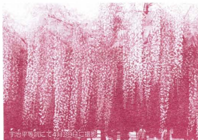
宇治平等院にて4月29日に撮影

昨年はここまで垂れ下がらなく、少しさびしかった宇治平等院の藤棚。今年はこんなにきれいに咲きました。