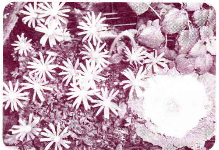
↑ブルーデージーがかわいいマイガーデン