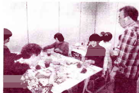
←前回の教室の風景です

「新世話好きおはさんのブログ」色々書いてます。見てね! www.house-pro.jp/