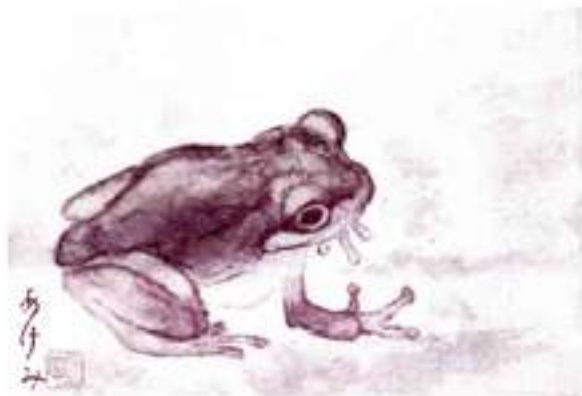
孫達が好きなかえるを書きました。つかもとあけみ画