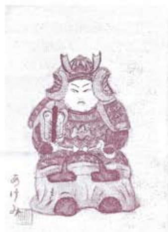
つかもとあけみ画