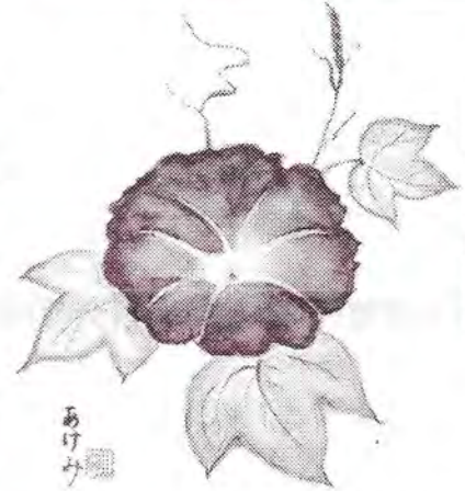
あさがおの絵があけみ

あなたはご自身の健康管理をどこまでされていますか？ 近頃のテレビ番組は健康に関するテーマが沢山取り上げられています。〇〇ジュースはいつ飲めば効果的。アマニ油が認知症予防にいいとか、卵は1日何個食べた方がいいとか、自分自身がそれを聞いてもどこまで実践できるのか少し考えてしまいます。昔の人が言っておられた「腹八分目でよくかんで食べましょう」位であればできますよね。健康で楽しい毎日を過ごせる事が何よりも一番幸せな事です。そのために私は好きな仕事をして人様のお役に立てて、美味しい物を毎日食べられる事に感謝し少しだけですが身体にいいと言われる食品を毎日食べています。こんなごく普通の生活が出来事に心から感謝です。皆様も日々お健やかに過ごして下さいませ。